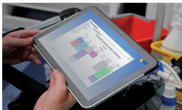
CleanManager i brug på en tablet.